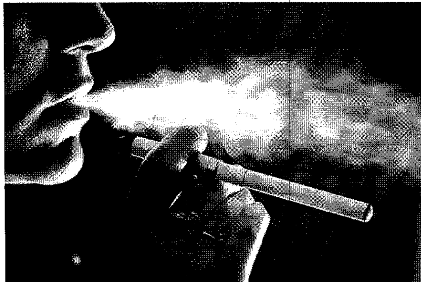
Fumante experimenta cigarro eletrônico.

Contrariando conclusões da própria literatura científica médica, um grupo de otorrinolaringologistas testemunhou em favor da indústria do tabaco em nove processos judiciais entre 2009 e 2014, na Flórida, nos Estados Unidos, alegando que o uso de cigarros não foi causa de câncer de fumantes autores das ações, concluiu um estudo da Universidade Stanford publicado em 17 de julho no periódico "Laryngoscope".