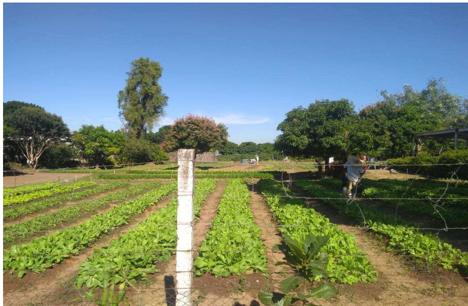
Horta I – produção de hortifrutis