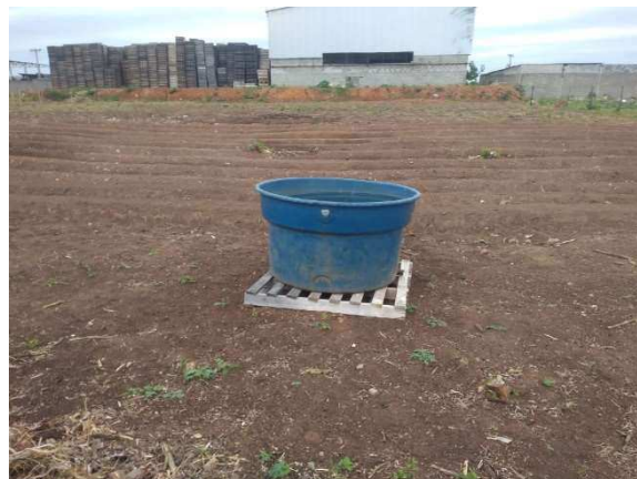
Horta II – produção e expansão de área