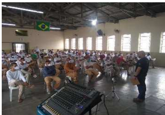
Palestra de orientação realizada (18/08/2020)

Ressalto que constantemente os internos são orientados a não jogar quaisquer tipos de material por meio da rede de esgoto a fim de não as danificar.