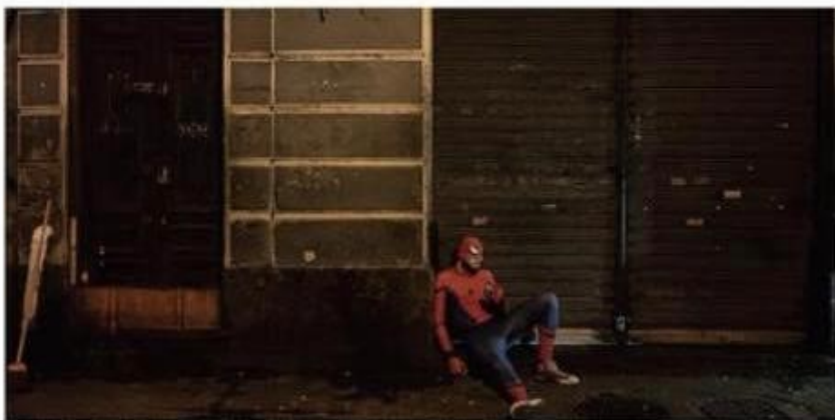
Fachada da Vaca Assada, após sua morte de despedida, no último dia 19. Bar carrega da Lagoa foi um dos que fecharam as portas pela pandemia.